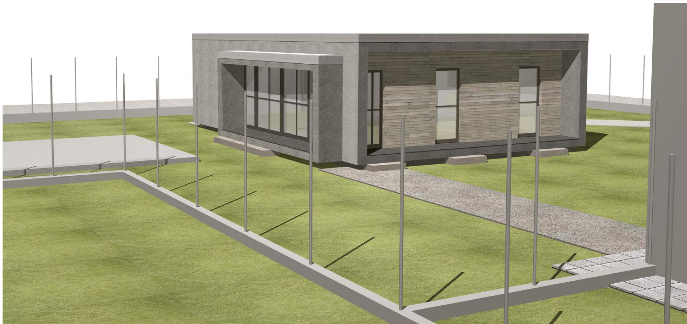
VISTA NORD - EST RIVOLTA VS CAMPO E SPOGLIATOI