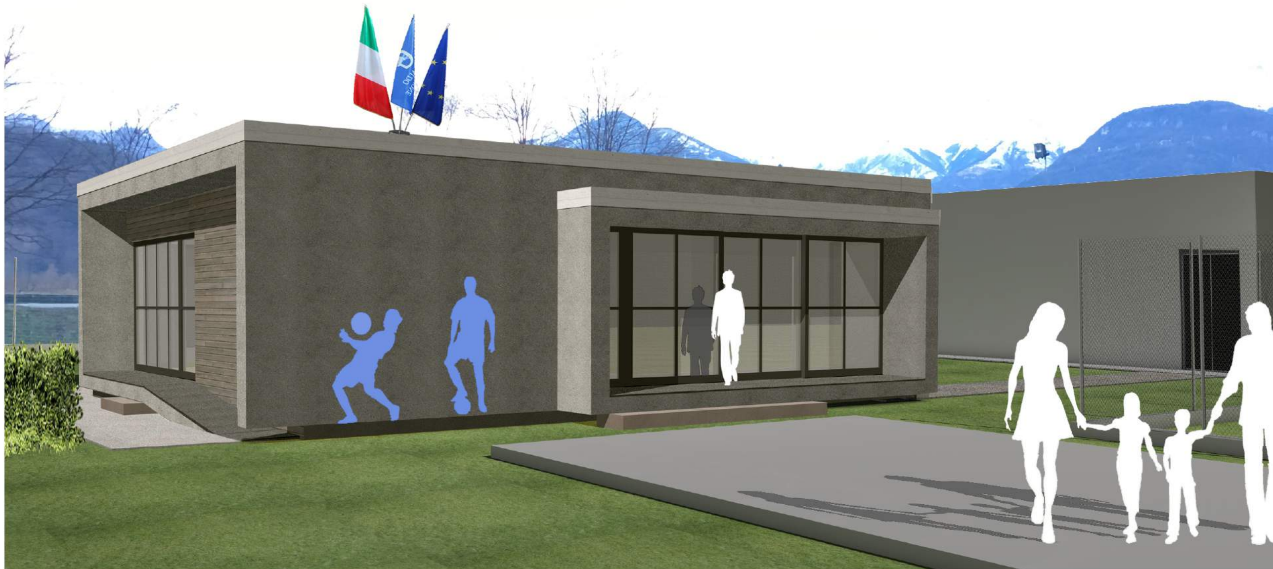
VISTA FRONTE EST ZONA DEHORS VS TRIBUNE