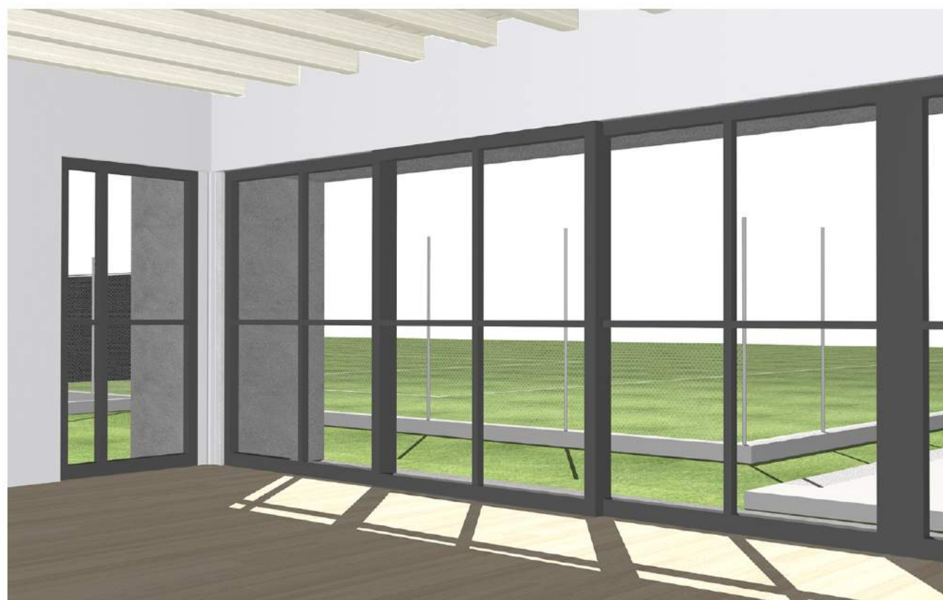
VISTA INTERNO SALA RELAX VS IL CAMPO GIOCO