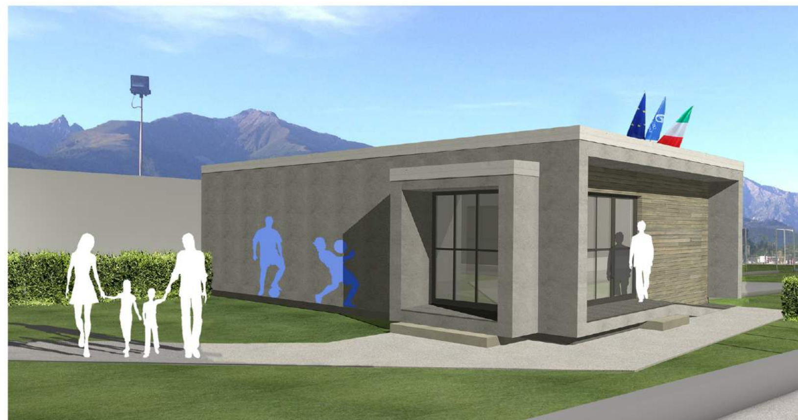
VISTA SULLA ZONA BIGLIETTERIA E INGRESSO CLUB HOUSE