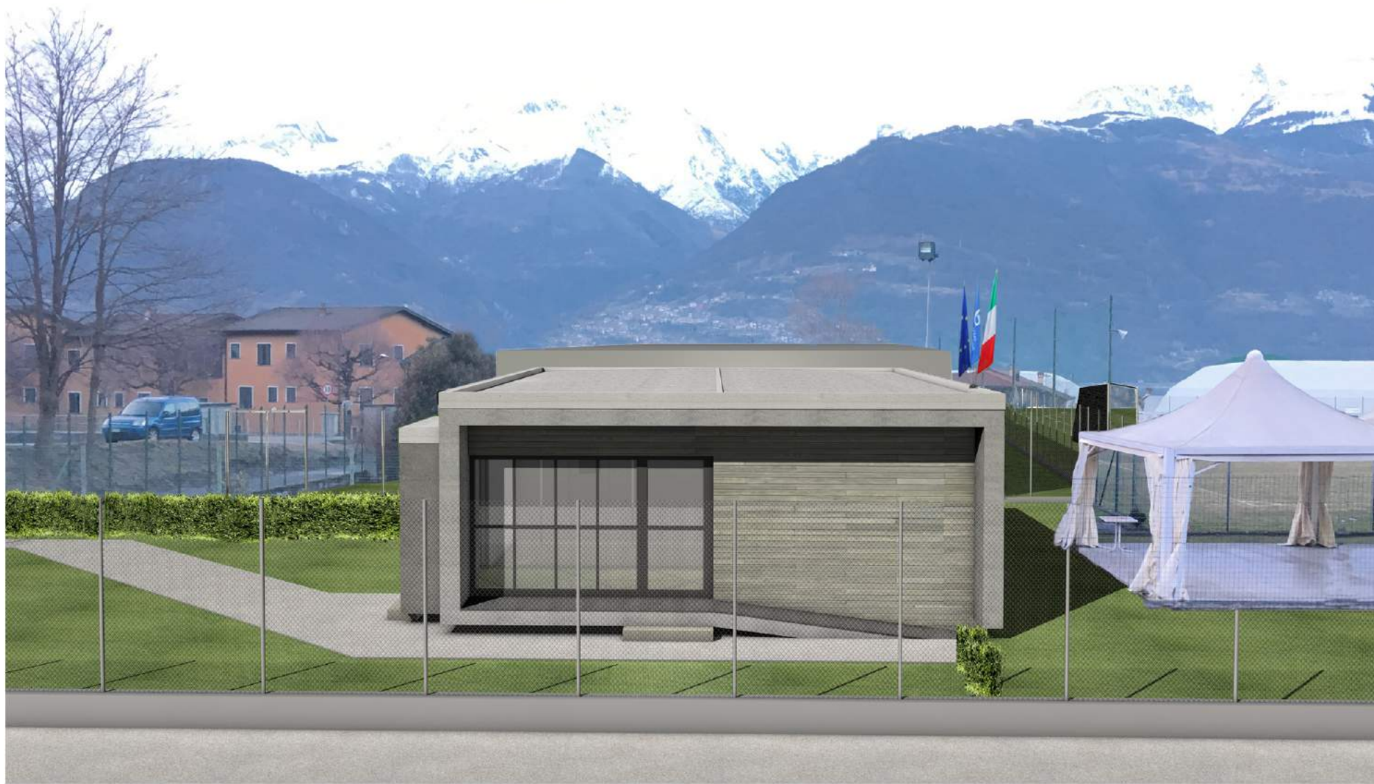
VISTA FRONTE SUD VS FERROVIA