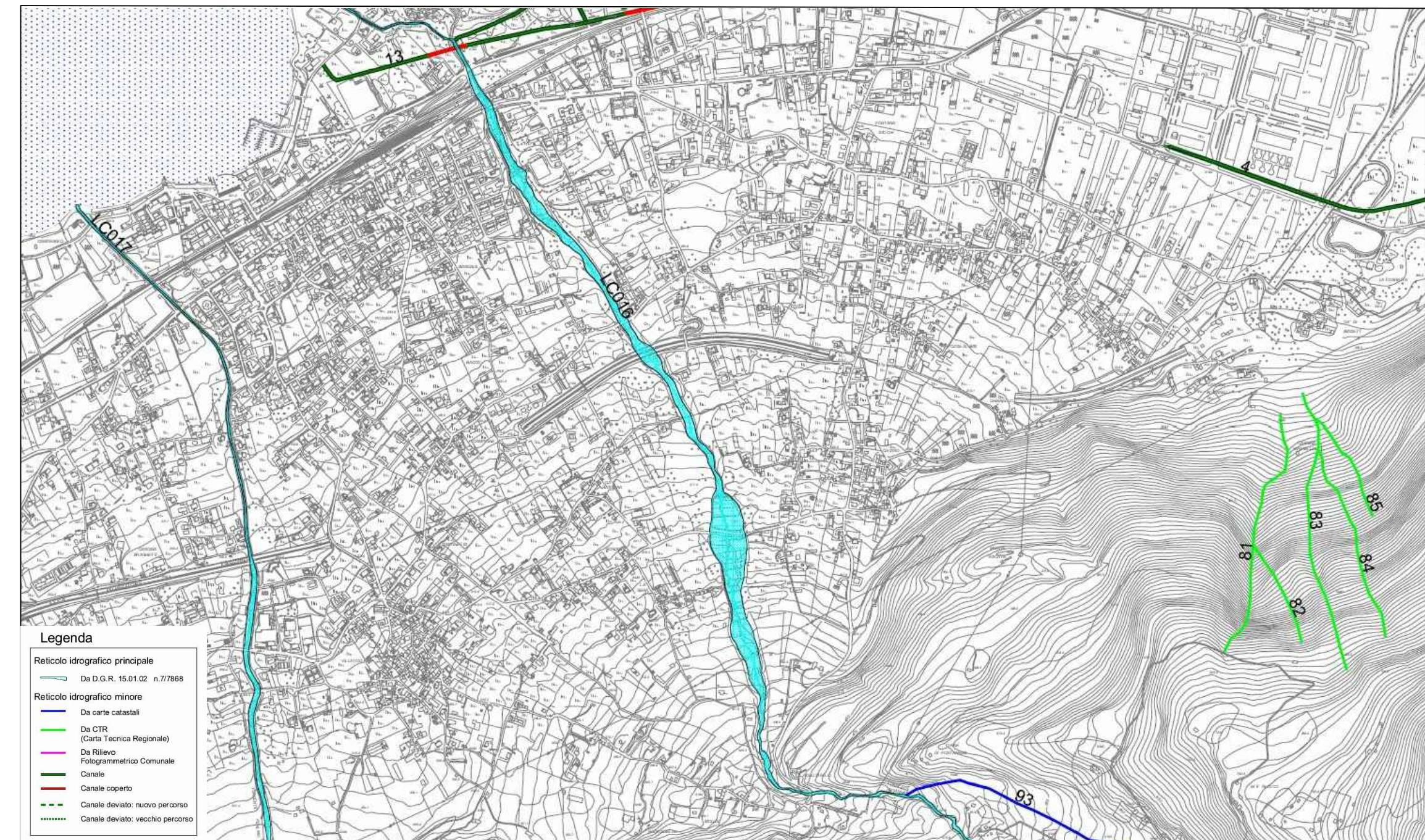
ESTRATTO PGT - COMPONENTE GEOLOGICA - CARTA DEL RETICOLO IDROGRAFICO